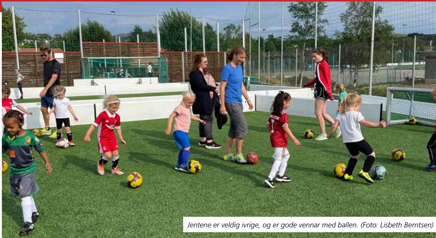
Jentene er veldig ivrige, og er gode vennar med ballen.