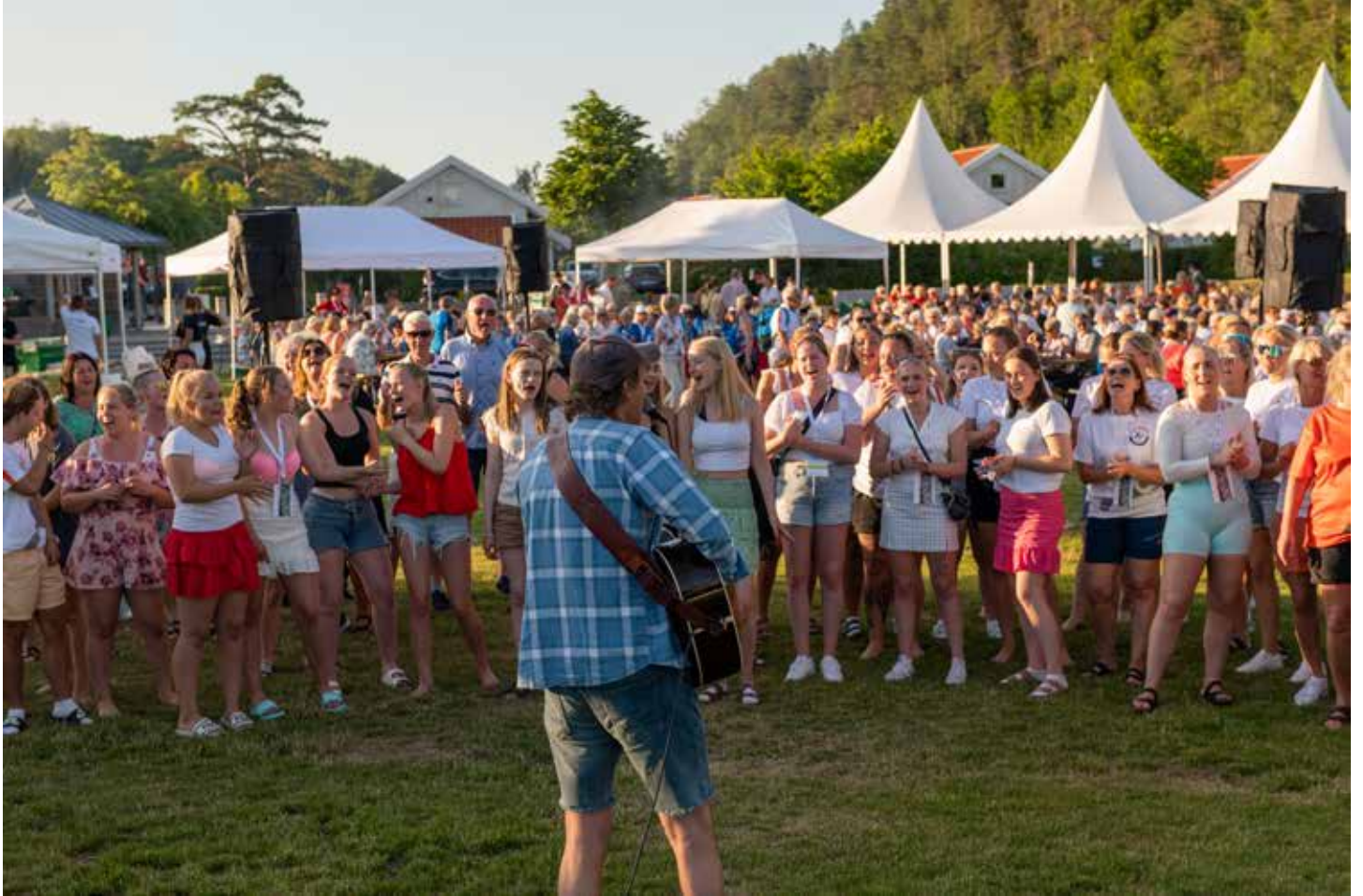
Offisielle bilder fra LTS; Foto: Carina Log Borge