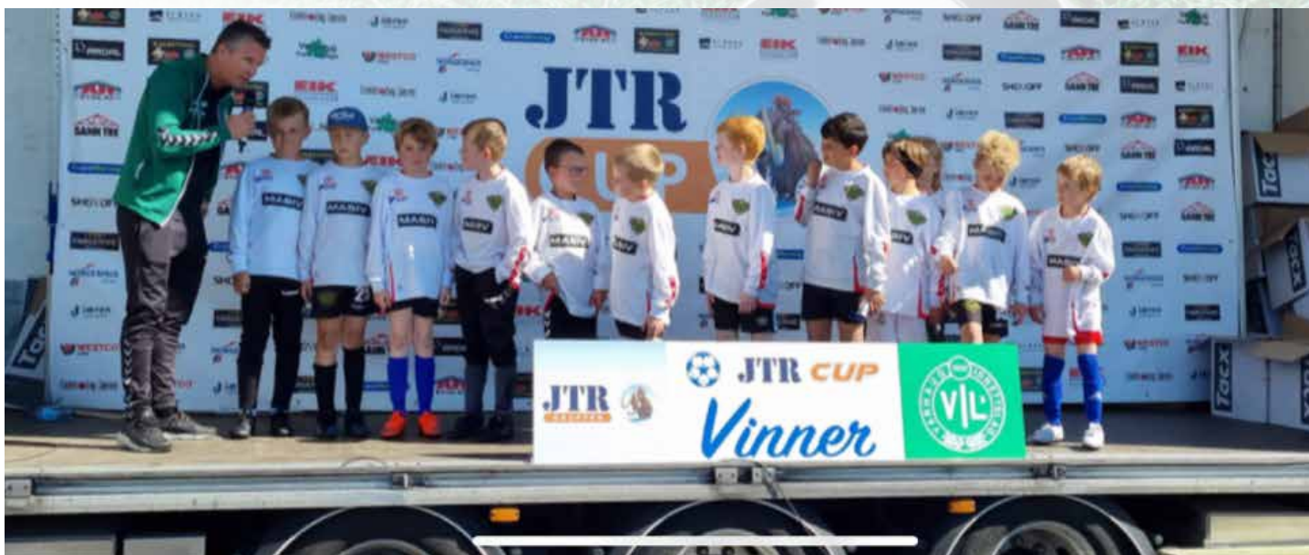
Gjengen får premie på Varhaug