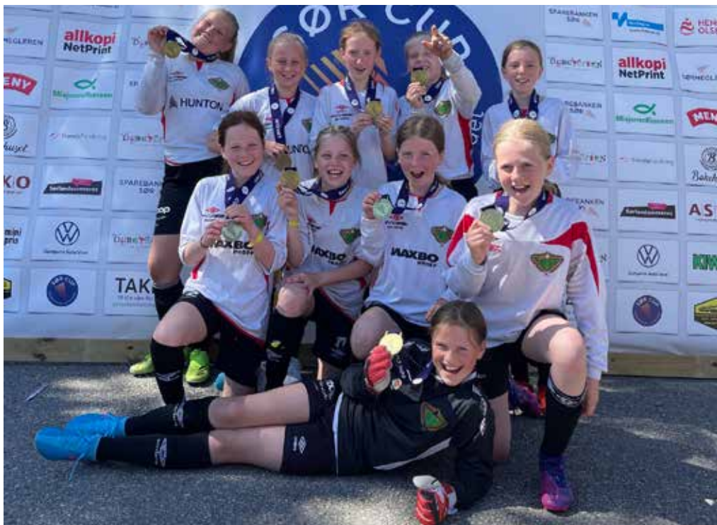
Glade og fornøyde jenter etter en vellykket turnering.